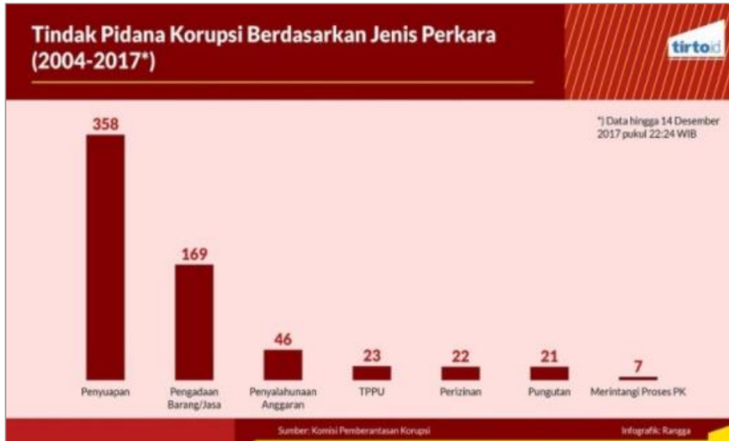
Grafik 1 Tindak Pidana Korupsi Berdasar Kegiatan Tahun 2004 – 2017